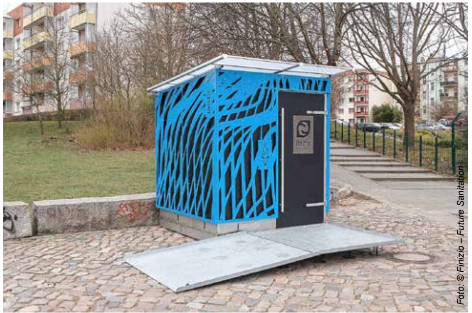
Abb. 2: Öffentliche Trockentrenntoilette in Eberswalde

Der Haken an der Sache? Menschliche Fäkalien sind gemäß Düngemittelverordnung bislang nicht als Ausgangsstoff für die Herstellung von Düngemitteln zugelassen.