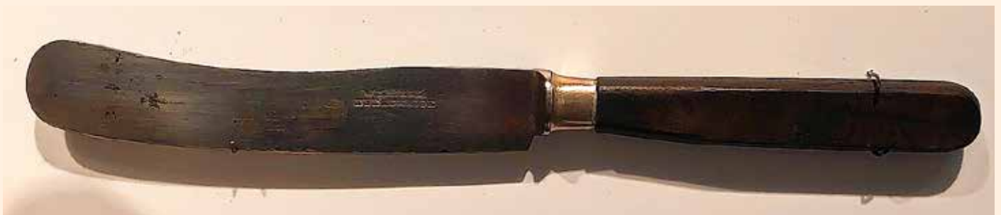
Die Messerklinge mit dem Stempel „W. Thiele / Eberswalde“, 19. Jahrhundert, Sammlung Museum Eberswalde