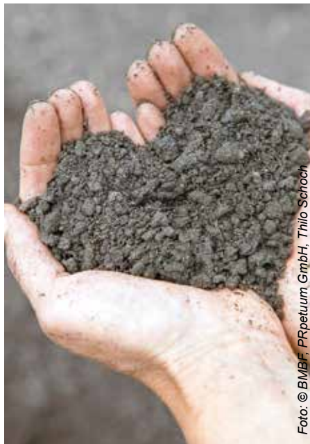
Abb. 1: Humusdünger aus Inhalten von Trockentoiletten (H.I.T.)

Stattdessen werden die Recyclingdünger aus Fäzes und Urin zu wissenschaftlichen Zwecken in Feldversuchen eingesetzt. So wurde im letzten Jahr Silomais mit H.I.T. und dem Mehrnährstoffdünger aus Urin auf einer Fläche der Schorheider Agrar GmbH angebaut. Im Ergebnis konnten mit den Recyclingdüngern vergleichbare Erträge wie mit einer mineralischen Düngung erzielt werden.