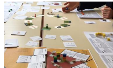
Workshop mit komm:loop Mai 2023