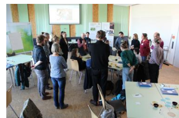
Erster Testdurchlauf mit Akteur:innen aus beobachtenden Kommunen im Oktober 2022